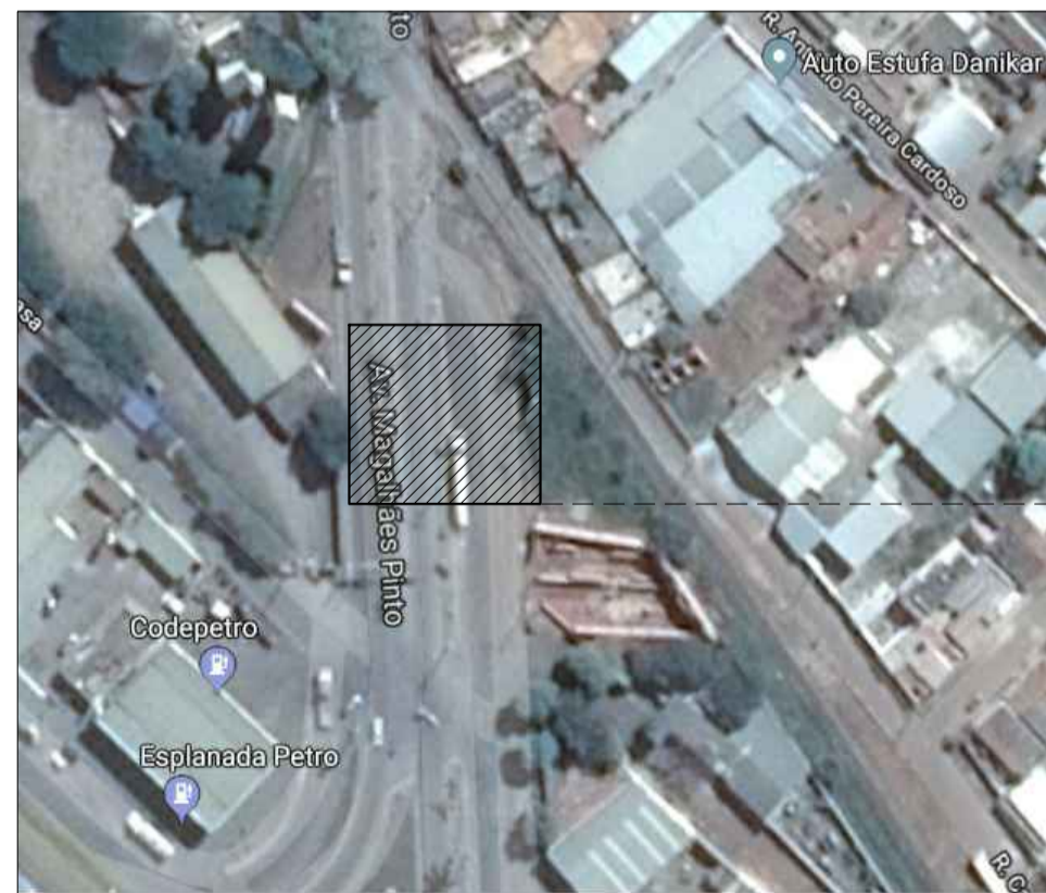
IMAGEM AÉREA REFERENCIAL SEM ESCALA