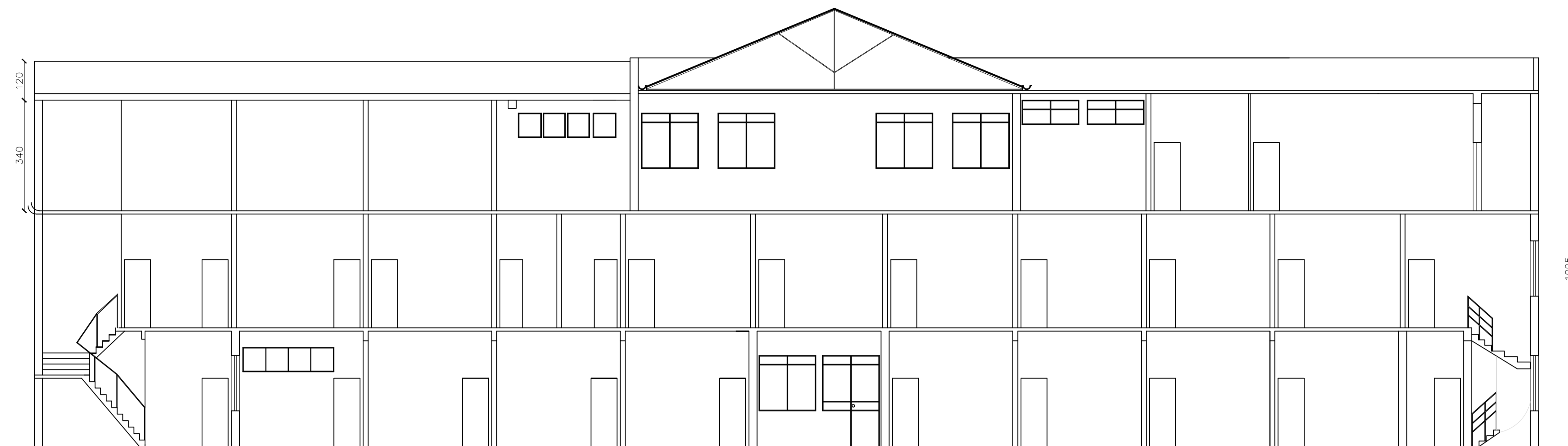
CORTE AB ESCALA 1/100