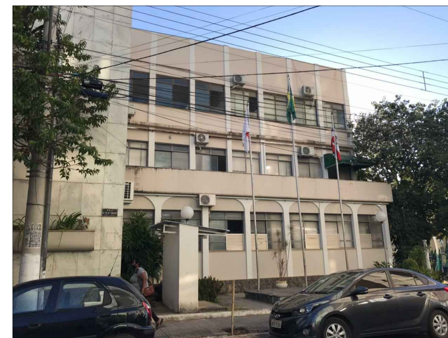
PADRÃO FACHADA A SER SEGUIDO