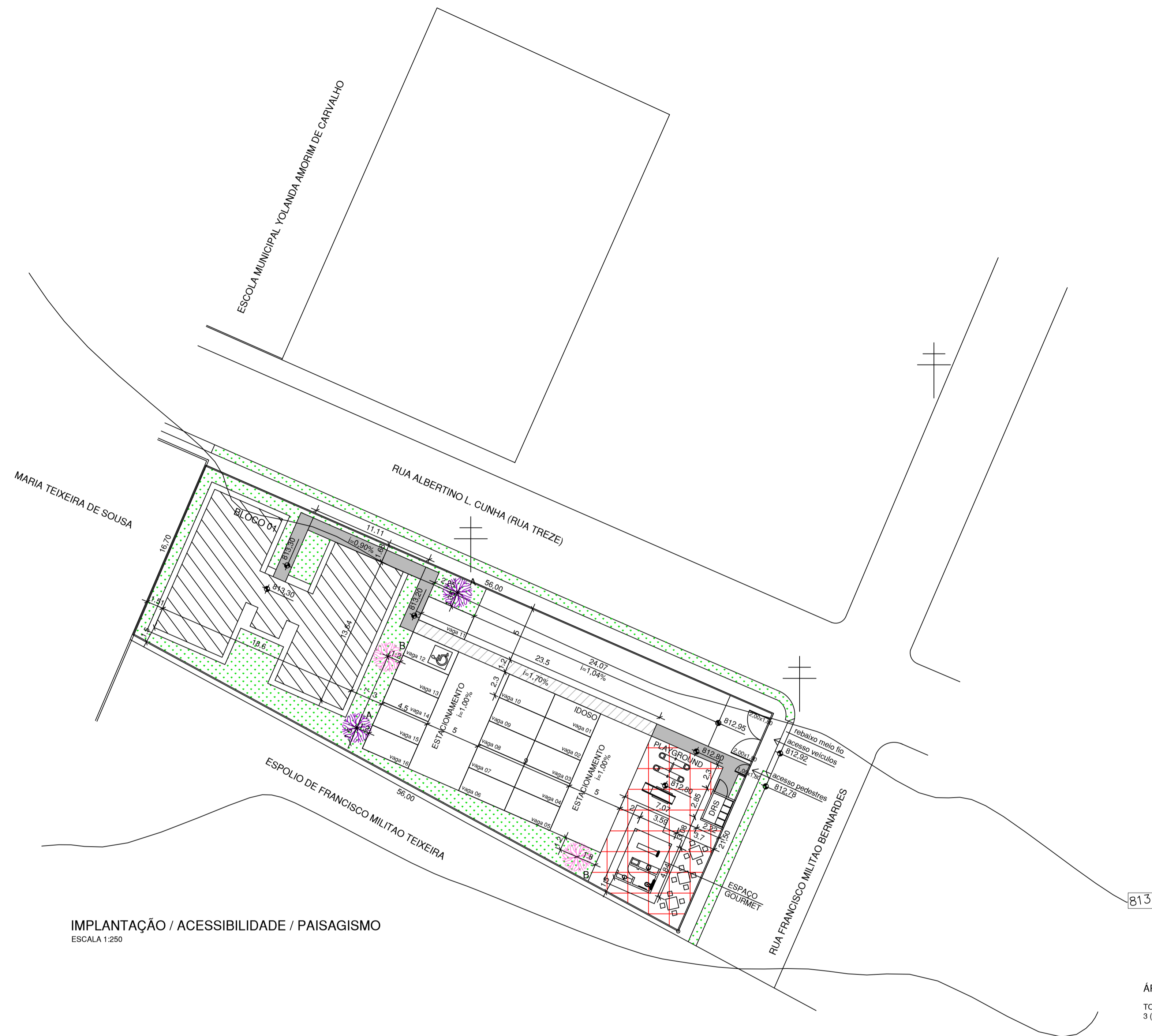
IMPLANTAÇÃO / ACESSIBILIDADE / PAISAGISMO ESCALA 1:250